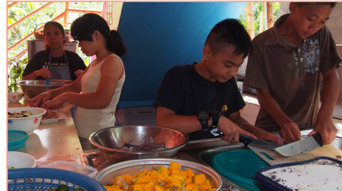
Les inclure à la préparation des repas a rendu les enfants assez autonomes en cuisine. Les plus grands savent aussi se servir d'une poêle.

• Nous aimerions vraiment accueillir plus d'enfants, mais nous sommes confrontés à plusieurs obstacles: d'une part, la construction de la clôture et le suivi pour localiser les familles ont absorbé une grande partie de nos ressources. D'autre part, le prix des articles de base a augmenté d'environ 20%. Nous avons également dû adapter les salaires du personnel.