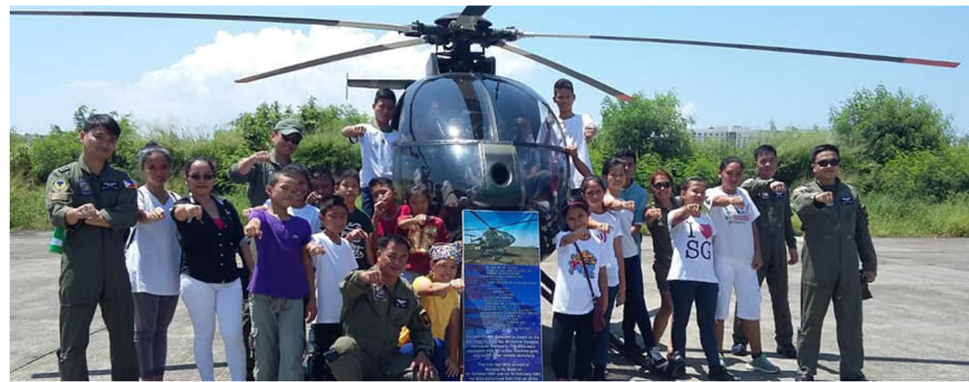
Les enfants de HTO ont été impressionnés par les hélicoptères de l'armée de l'air philippine lors d'une visite exclusive de la base aérienne (à seulement 4 km de HTO) offerte récemment par un membre du personnel de l'armée.

En soutenant une petite organisation comme HTO, qui fournit des services de qualité aux enfants les plus vulnérables de Zamboanga, chaque donateur contribue à ce processus de paix. Donner «de l'espoir et un avenir» à des enfants dans une zone de conflit est un investissement pour leur avenir et aide en même temps à améliorer l'environnement général de la région.